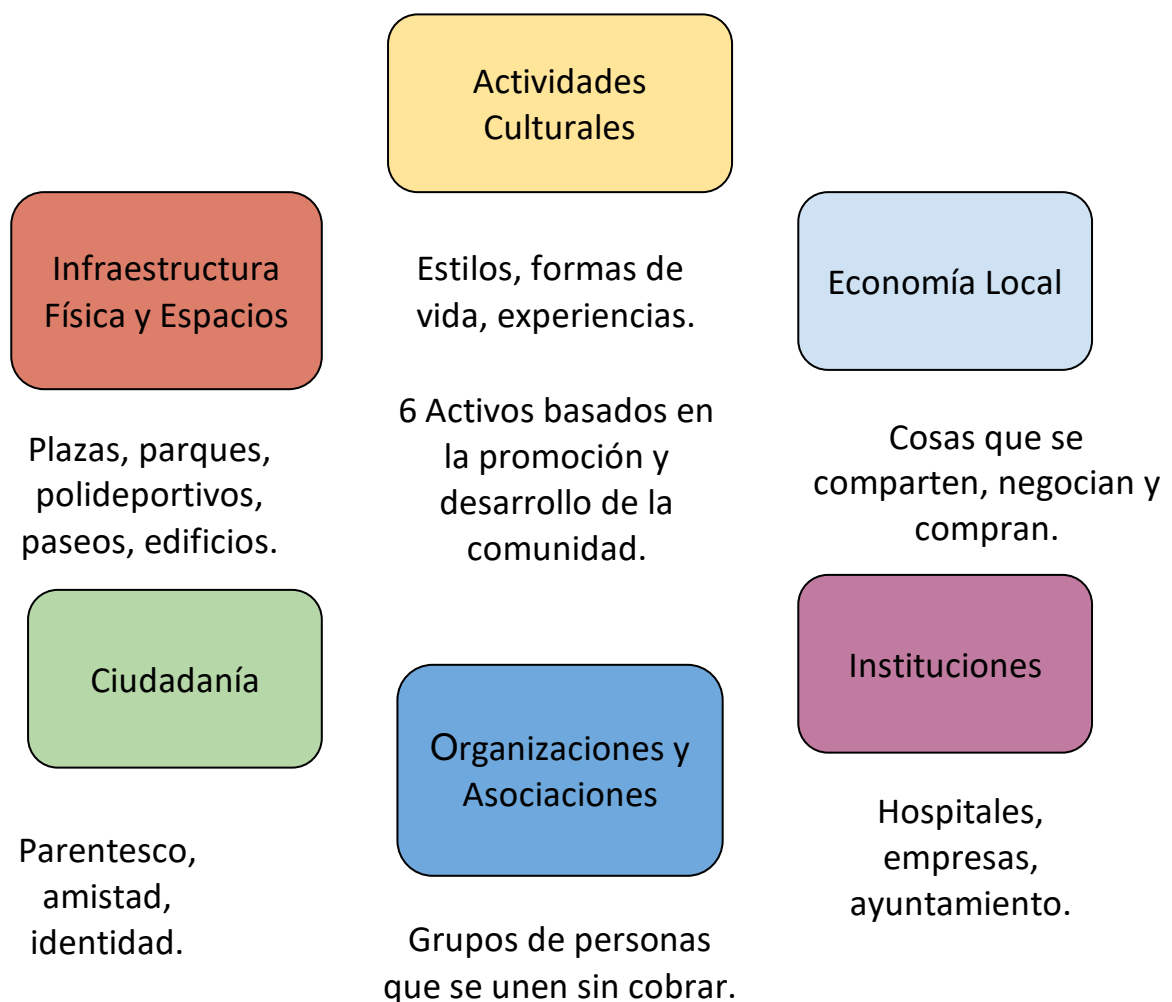
Figura 1. Esquema de activos para la salud

Los problemas de salud y concretamente los problemas de salud mental tienen una interrelación multifactorial. De manera que están estrechamente vinculados el estado físico y mental con el estilo de vida saludable. Conductas poco saludables como el consumo de alcohol, tabaco, drogas, sedentarismo, mala alimentación, también terminan por afectar a las relaciones interculturales, emocionales y sexuales, incluyendo el uso inadecuado de la tecnología y la escasa actividad deportiva.